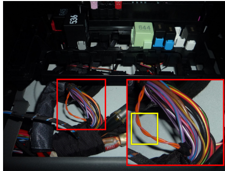
Рис. 1. Подключение CAN