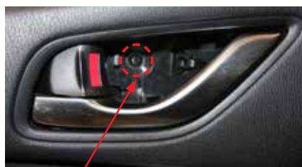
2. Отверните саморез 1