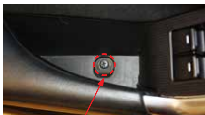
4. Отверните саморез 2