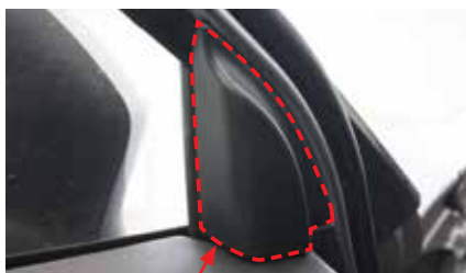
5. Демонтируйте декоративную панель