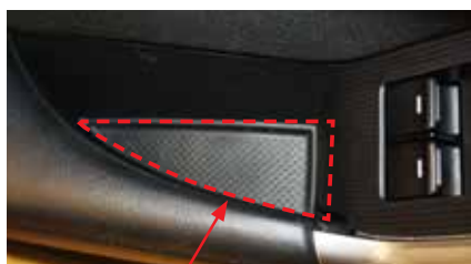
3. Демонтируйте заглушку 2