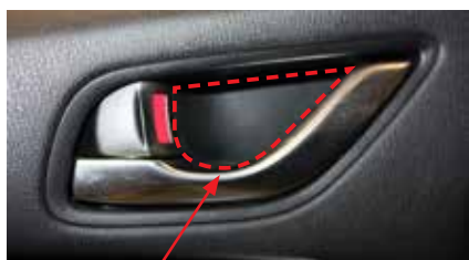
1. Демонтируйте заглушку 1