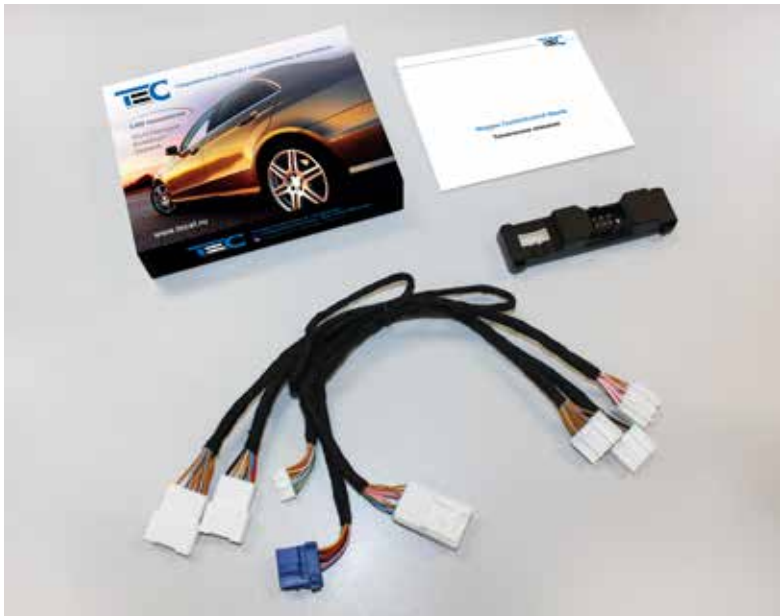
Рис. 1. Комплект поставки

Модуль устанавливается в двери водителя, подключается «разъем в разъем» с помощью специального жгута, входящего в комплект поставки (см. рисунок 1). Протягивать провода из салона автомобиля в дверь не потребуется – модуль получает управляющие команды от центрального блока системы Призрак по шине LIN.