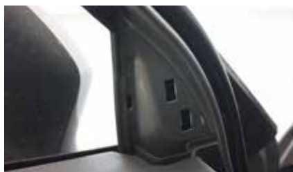
6. Вид после демонтажа декоративной панели